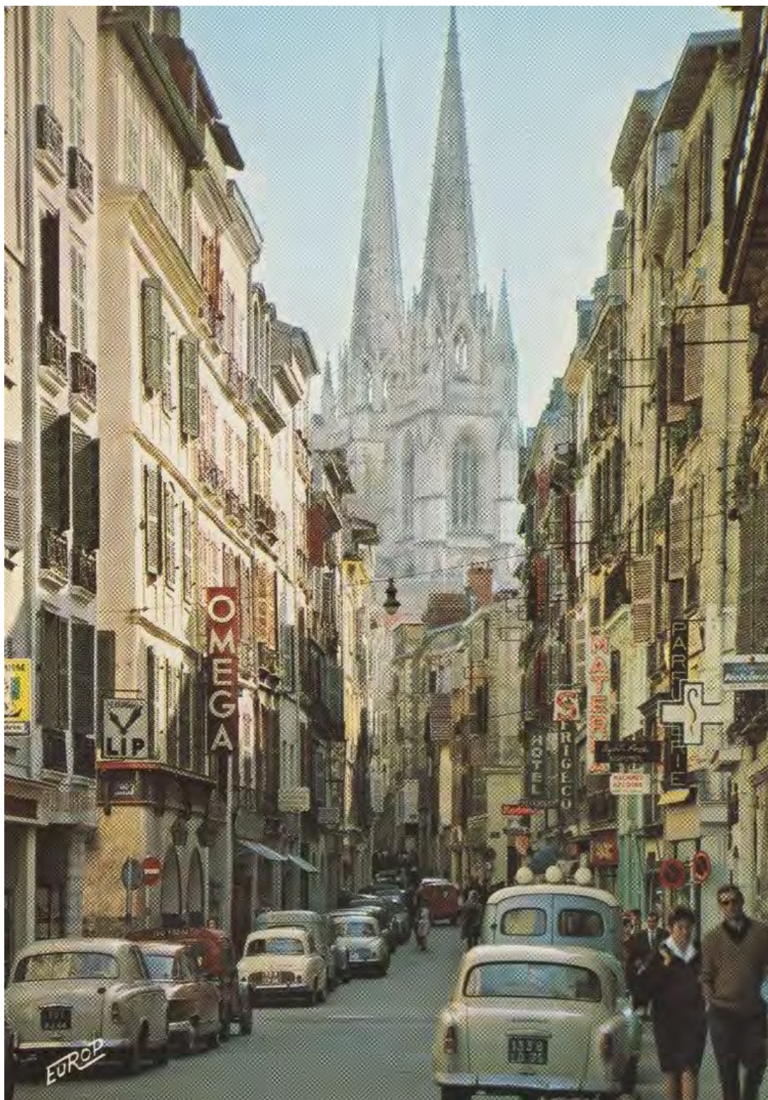
BAYONNE (Basses Pyrénées) La rue Port Neuf. Editions de l'Europe

L'éditeur précisant "Couleurs naturelles", nous pouvons affirmer être en présence de deux berlines beige 516! A droite une "7" immatriculée 1339 LD 75 vers le milieu de l'année 1960, et à gauche une 403 B modèle 1960 (reconnaisable à ses butoirs de pare choc courts et à ses baguettes larges) immatriculée début 1962, 301 KJ 44.