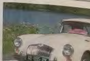
La MGA figurent parmi les plus anciennes.