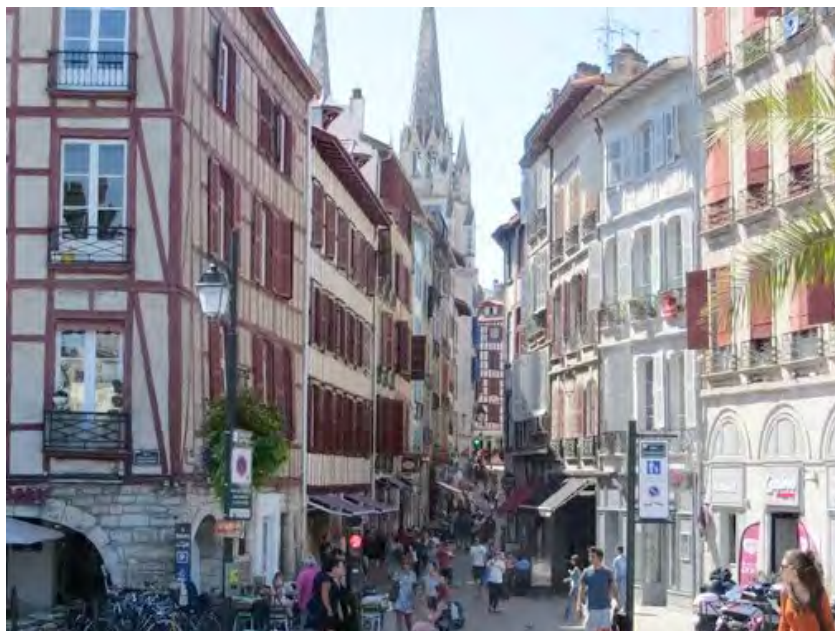
La vieille ville de BAYONNE