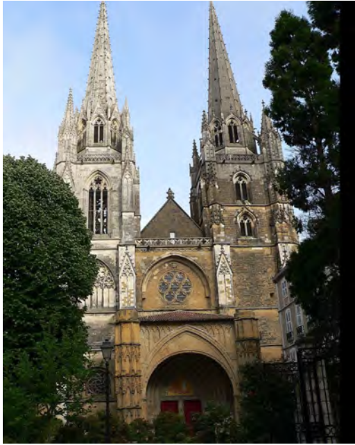
La cathédrale Saint Marie et le Cloître