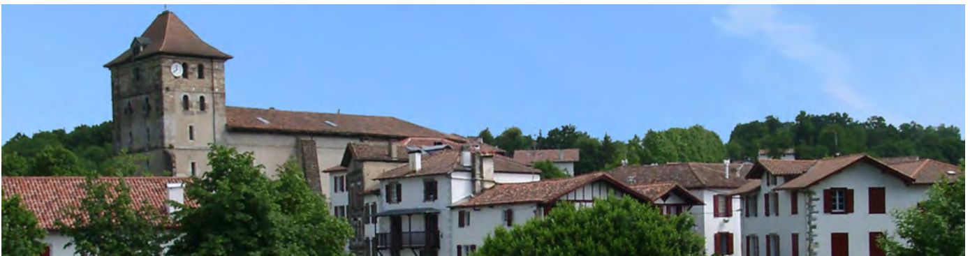
Espelette vue d'ensemble, et ci-dessous Plage de BIARRITZ