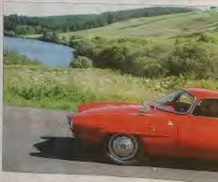
▲ Une Alfa Romeo Giulietta SS contourne le lac de Guéry.