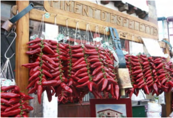
Le piment d'ESPELETTE