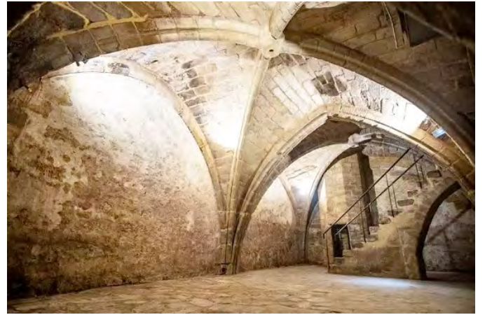
Les caves Gothiques