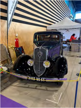
Le Stand du Club 403, le Stand MG et le Stand Peugeot,