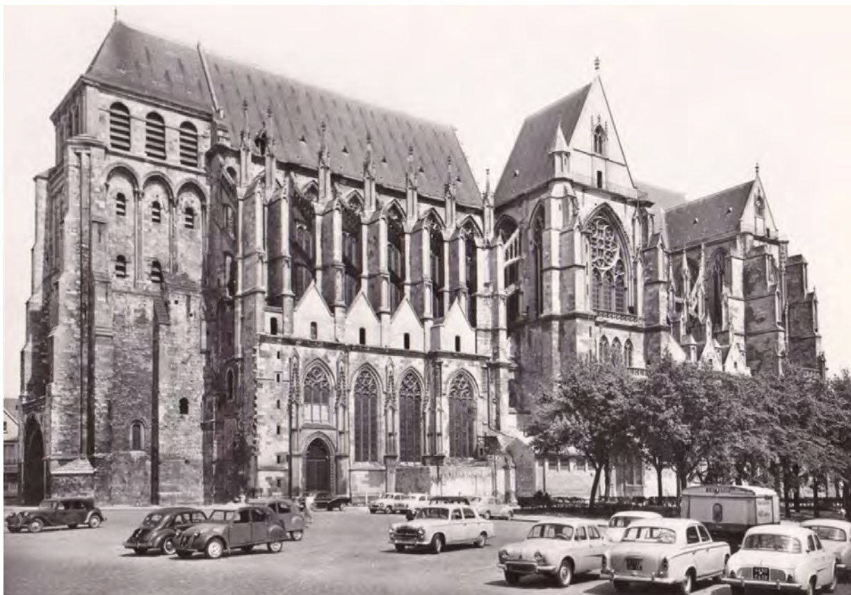
Saint Quentin (Aisne); la basilique.

Les Peugeot sont en minorité sur ce cliché du début des années 1960... Une 403 8cv de dos (1960/62) et une autre berline 8cv (avant 1959) qui démarre. Au fond de l'image on distingue l'arrière d'une 203 berline.