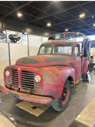
Outre des Grands bis du XIXème siècle, un Delahaye type 171 et une coque de 404 cabriolet présentée par un carrossier.