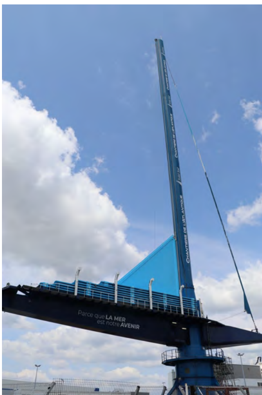
Une promenade autour des chantiers nous a amenés devant le prototype de la voile bleue (85 m de haut) destiné à certains futurs cargos à voiles (et à moteur !!). Ce principe n'est pas encore commercialisé, mais cela ne devrait plus tarder. En fond non pas d'écran, mais de vision, le paquebot MSC Euribia qui sera mis à l'eau en juin 2023, mais il reste un peu de travail.... Un peu